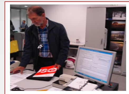
11 de junio Concentración y entrega de manifiesto en la Dirección de Educación de Burgos