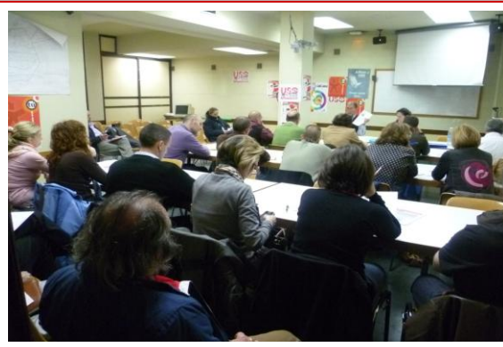
16 de mayo, reunión con afiliados/as y simpatizantes en la sede de USO. para informar sobre los recortes.