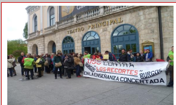
Concentración 23 de Mayo. Frente al Teatro Principal