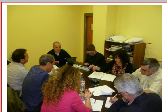
Ejecutiva Regional de FEUSO CyL y los Secretarios de Formación y de Organización de la Ejecutiva Nacional.